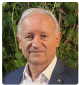
Bernard Vallon Maire de Montélier

Vous êtes nombreux à vous interroger sur la reprise des services publics et notamment sur la réouverture des écoles et services périscolaires.